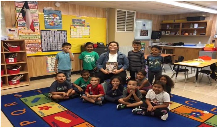
En la clase de la Señora Tyger, los alumnos escuchan los cuentos que se tratan todo del mundo y les encantan escribir.